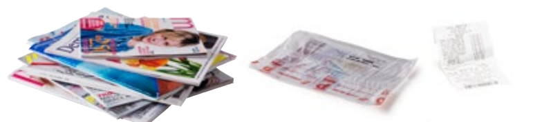
JOURNAUX, CARNETS, LIVRES, TICKETS DE CAISSE, EMBALLAGES DE MAGAZINES