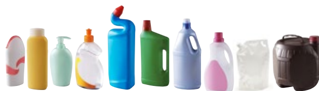
FLAONS, BiDONS, SPRAYS