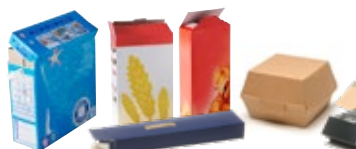
BOÎTES, PAQUETS, SACHETS