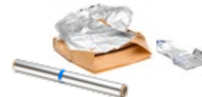
FEUILLES, PAPIER ALU