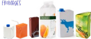
BRIQUES, BOUCHONS, PAILLES