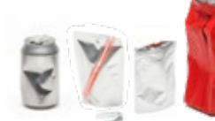
CANETTES, GOURDES, PAQUETS