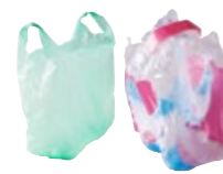
SACS, EMBALLAGES DE PACKS