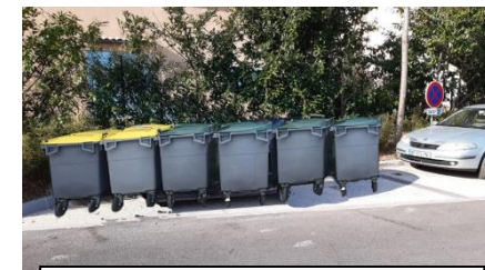
PARKING PIERRE PUGET

Vous trouverez au dos du document une carte avec tous les points de regroupement.