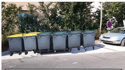
PARKING PIERRE PUGET

Vous trouverez au dos du document une carte avec tous les points de regroupement.